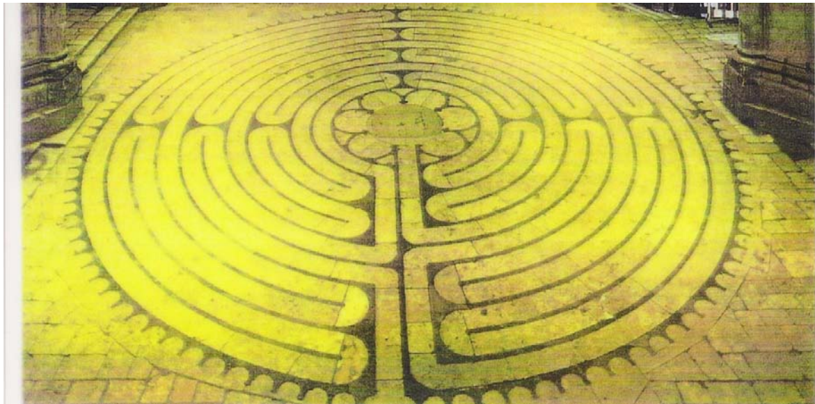
Das Bodenlabyrinth von Chartres

Das größte Labyrinth befindet sich in der Kathedrale von Chartres in Frankreich. Es ist das Vorbild für alle weiteren christlichen Labyrinth und wird heute mehr denn je von suchenden Menschen begangen.