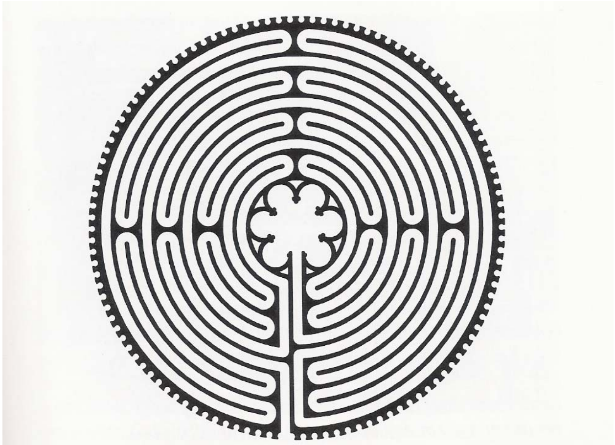
Großes Labyrinth im Mittelschiff der Kathedrale von Chartres, Frankreich

Nicht die Einmaligkeit sichert den Erfolg, sondern ein bewusstes wiederholtes Umkreisen der Dinge.