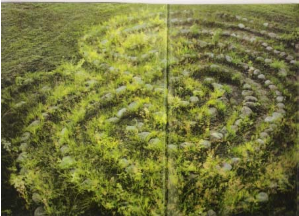
Ein altes Labyrinth in Schweden

Obige Steinlabyrinth können wir uns sehr gut als Muster für „unser“ Labyrinth im Nationalpark Eifel vorstellen, weil es kostengünstig und nicht aufwendig in der Pflege ist.