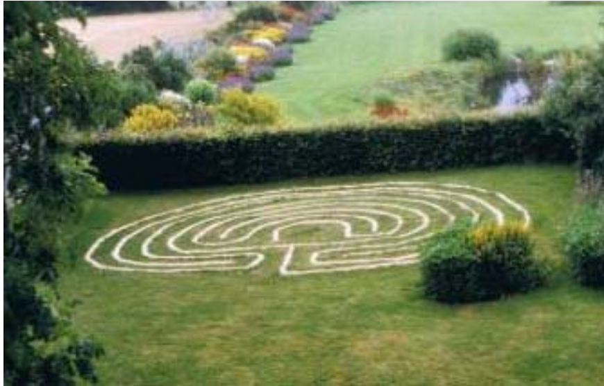
Privates Labyrinth nach dem Vorbild von Kreta in Kesternich/Eifel

Öffne deine Sinne für alles was dir begegnet. Atme ein – atme aus und finde Ruhe. Wünsche dir, dass du die Mitte findest und heil wirst.