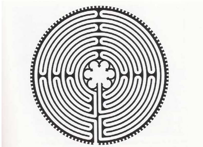
Das Bodenlabyrinth von Chartres

Seit unbekannter Zeit sind Pilger auf heiligen Straßen unterwegs. Das Ziel ist dasselbe wie im Labyrinth – Die Suche nach der Mitte.