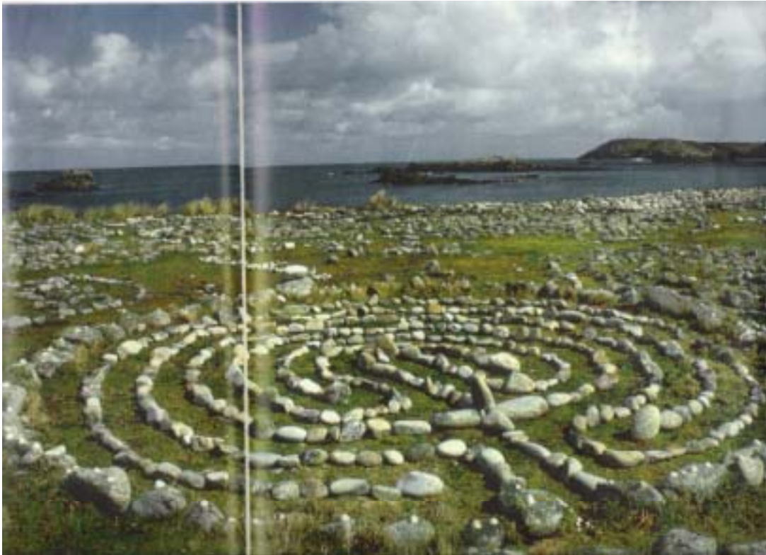
Ein Steinlabyrinth aus Dänemark

Für die Seefahrer des Nordens war der Bau von Labyrinth ein gelebtes Gebet um guten Wind und glückliche Heimkehr und ein Zeitvertreib, wenn man bei schlechtem Wetter festsaß.